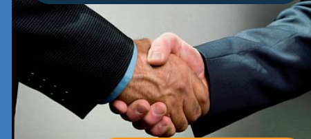
Centro de Negocios