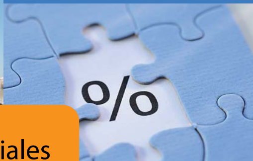
Reducción de Costes